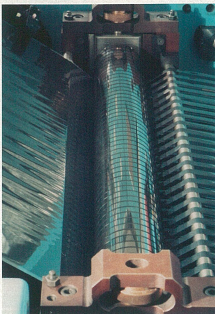
Jestli máte dobré oči, dokážete si sami spočítat, kolik proužků magnetického pásku se nařeže z jedné role.

linka, která dokáže staré kazety stoprocentně rozebrat a použitelné části pak slouží k výrobě kazet nových, případně k jinému průmyslovému použití.